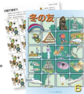
※6年の表紙、付録が変わりました。